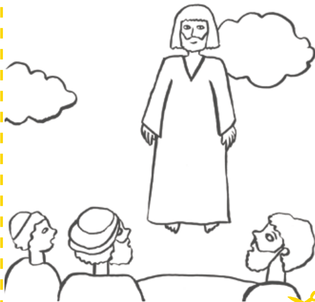
Illustration : Emmanuelle Tchoukriel, Pomme d'Api Soleil.