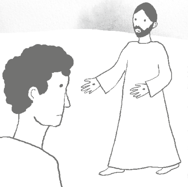
Illustration : Vincent Bourgeau, Pomme d'Api Soleil.