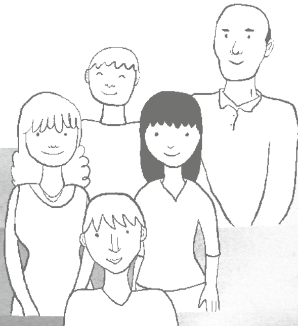
Illustration : Vincent Bourgeau, Pomme d'Api Soleil.