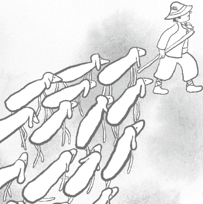
Illustration : Vincent Bourgeau, Pomme d'Api Soleil.