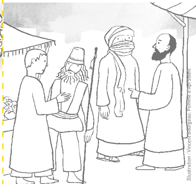
Illustration : Vincent Bourgeau, Pomme d'Api Soleil.