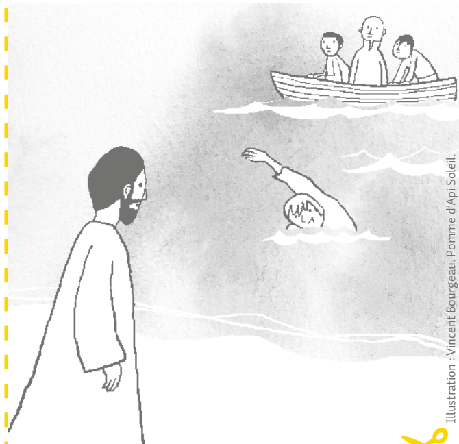
Illustration : Vincent Bourgeau, Pomme d'Api Soleil.